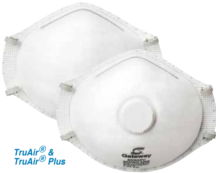
TruAir® & TruAir® Plus